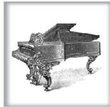
演奏级三角钢琴V 黑檀木、蔷薇木或桃木 交叉弦列；坚实的金属外壳和 金属表壳弦轴