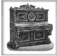
立式演奏钢琴XVI 黑檀木、蔷薇木或桃木 交叉弦列；坚实的金属外壳和 金属表壳弦轴