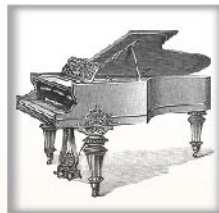
中钢琴II 黑檀木、蔷薇木或桃木 交叉弦列；坚实的金属外壳和 金属表壳弦轴