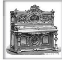
立式演奏钢琴XXII 独特浅色木材；洛可可风格 交叉弦列；坚实的金属外壳和 金属表壳弦轴