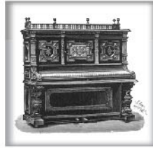
立式演奏钢琴XX 意大利黑胡桃木雕饰 交叉弦列；坚实的金属外壳和 金属表壳弦轴