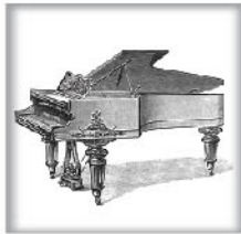
演奏级三角钢琴III 黑檀木、蔷薇木或桃木 交叉弦列；坚实的金属外壳和 金属表壳弦轴