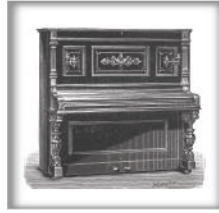
立式演奏钢琴IV 黑檀木、蔷薇木或桃木 交叉弦列；坚实的金属外壳和 金属表壳弦轴