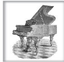
演奏级三角钢琴XXVI 独特浅色木材；洛可可风格 交叉弦列；坚实的金属外壳和 金属表壳弦轴