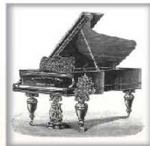
演奏大钢琴 黑檀木、蔷薇木或桃木 交叉弦列；坚实的金属外壳