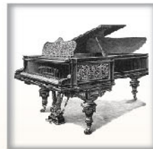
演奏大钢琴 黑檀木、蔷薇木或桃木 交叉弦列；坚实的金属外壳