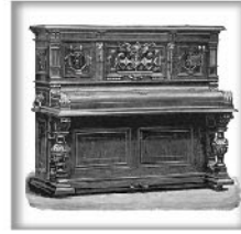
立式演奏钢琴XII 黑檀木、蔷薇木或桃木 交叉弦列；坚实的金属外壳和 金属表壳弦轴