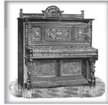
立式演奏钢琴XXI 桃木或橡木 交叉弦列；包裹弦轴