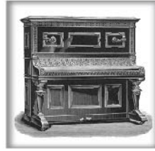
立式演奏钢琴XI 黑檀木、蔷薇木或桃木 交叉弦列；坚实的金属外壳和 金属表壳弦轴