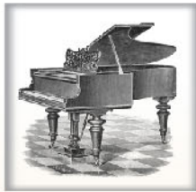
中钢琴I 黑檀木、蔷薇木或桃木 交叉弦列；包裹弦轴