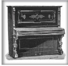
立式演奏钢琴III 黑檀木、蔷薇木或桃木 交叉弦列；坚实的金属外壳和 金属表壳弦轴