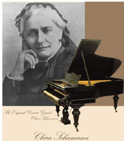
▲ 1874年，威廉·高天带领公司全体员工，为德国著名钢琴家，克拉拉·舒曼制作特别款三角钢琴