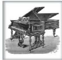
演奏级三角钢琴XXII 黑檀木、蔷薇木或桃木 交叉弦列；坚实的金属外壳和 金属表壳弦轴