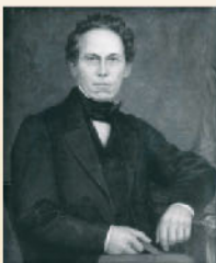
Founder of Grotrian Friedrich Grotrian 高天钢琴创办人 弗里德里希·高天